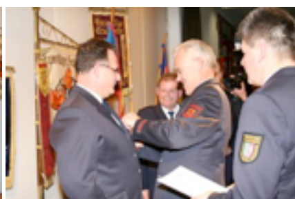
Deutsches Feuerwehrehrenzeichen in Silber