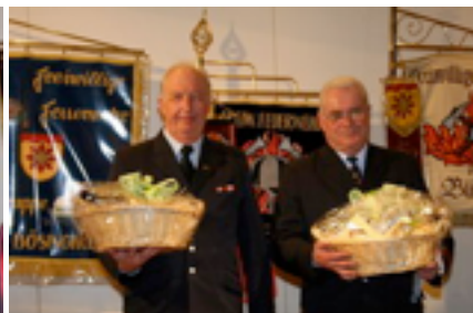
Verabschiedung in die Ehrenabteilung