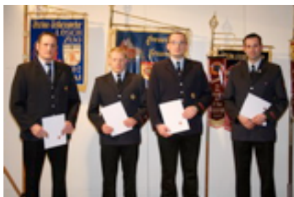
Beförderung zum Oberbrandmeister

In Hinblick auf die Mitgliederzahlen war 2009 ein erfreuliches Rekordjahr für die Meerbuscher Feuerwehr: 264 Feuerwehrfrauen und -männer (7 weiblich, 257 männlich, davon 16 hauptamtliche Kräfte auf der Feuerwache in Osterath), 68 Jugendfeuerwehrleute (14 Mädchen/54 Jungen) und 66 Mitglieder in der Ehrenabteilung gehörten zum Stichtag 31.12.2009 der Meerbuscher Feuerwehr an.