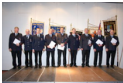
35 Jahre aktiven Feuerwehrdienst