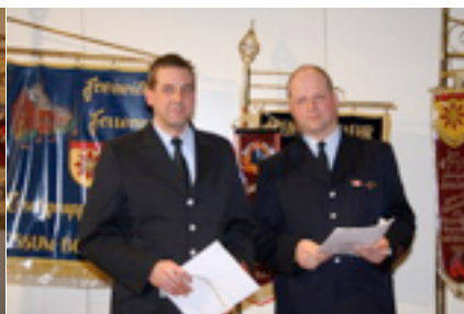
Beförderung zum Brandinspektor