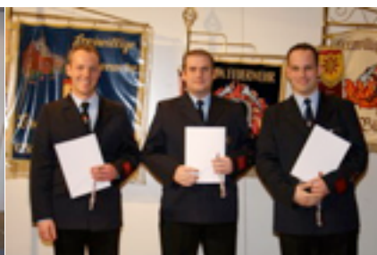
Beförderung zum Brandmeister

Im Jahr 2009 waren es im Einzelnen 99 Brandeinsätze, 111 Fehllalarme und 382 technische Hilfe-Einsätze (davon 140 Einsätze beim schweren Juli-Unwetter in Meerbusch).